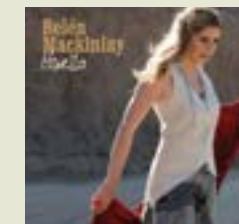
Canción del Jangadero